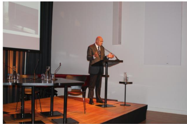
Inleiding door H.H. F. (Herman)Wijffels