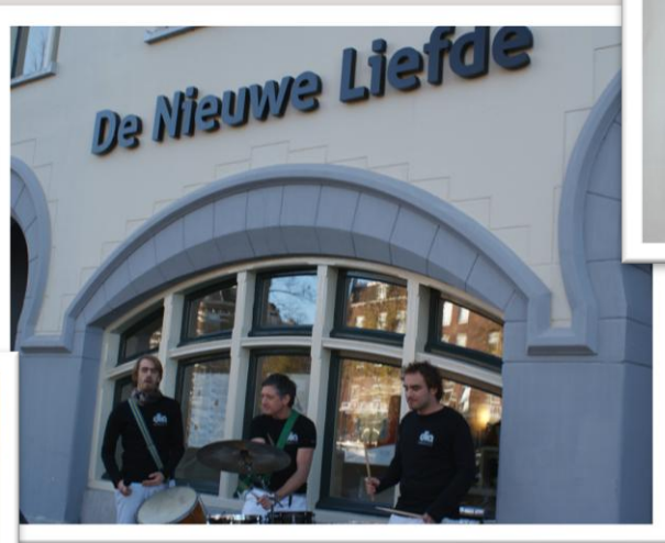
De Nieuwe Liefde, Amsterdam